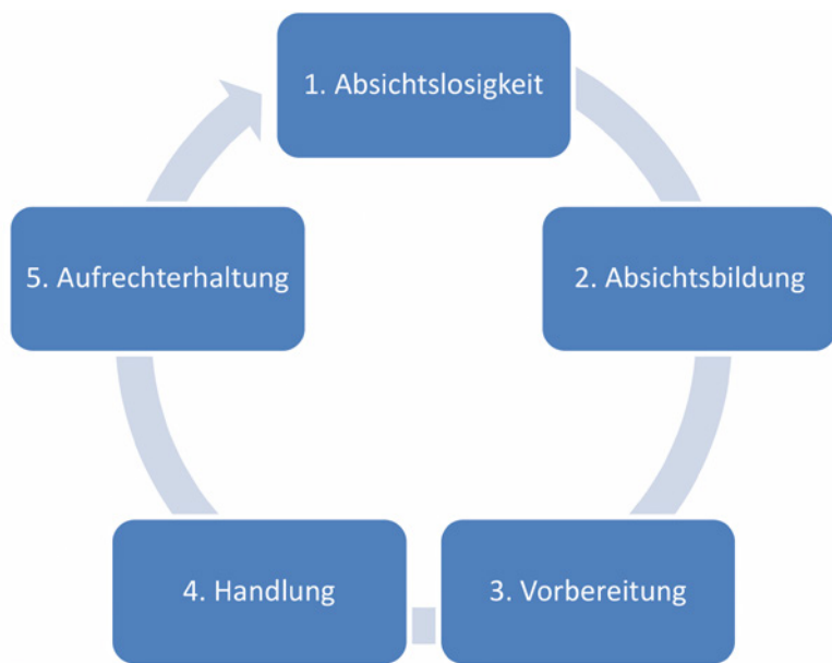
Abb. 3: Phasenmodell der Veränderungsmotivation (PROCHASKA und DICLEMENTE 1982 [10])