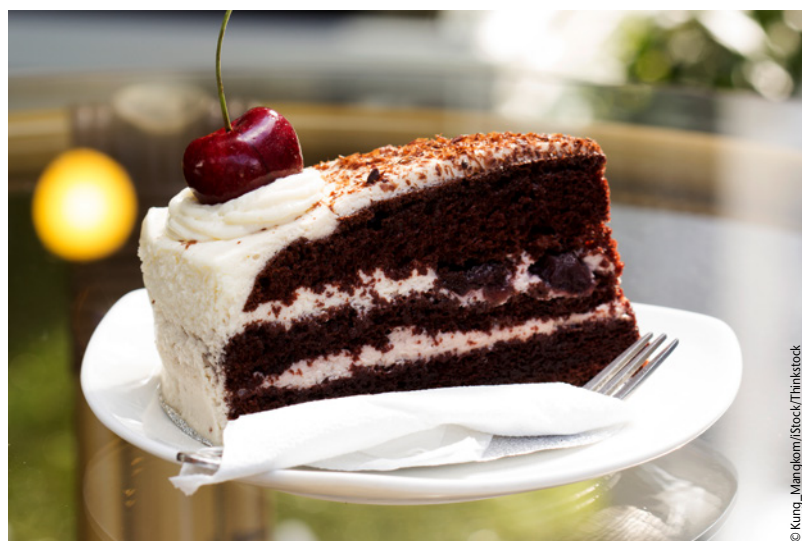
Abb. 4: Aufgrund der Triggerung von Suchtverlangen sollten auch alkoholhaltige und nach Alkohol schmeckende Lebensmittel von ehemals Alkoholabhängigen gemieden werden.

Riskanter, übermäßiger Alkoholkonsum ist häufig ein Teilproblem einer falschen Ernährung. Ernährungsfachkräfte sind hier gefragt, Patienten für entsprechende Zusammenhänge zu sensibilisieren und in der Motivation zur Verhaltensänderung zu unterstützen. Wenn sich in der Ernährungsbe-